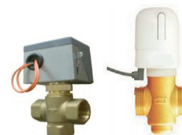
3-х (2-х) ходовые клапаны различного исполнения - модель CDV5871 (CDV5471)