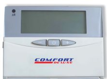
Настенный пульт ДУ (Только опционально при наличии платы PCB)